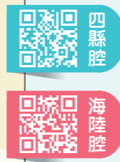
▲看動畫學客語用字，深入淺出、寓教於樂。