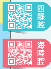
▲全新課文chant，節奏念唱，激發學生學習興趣。